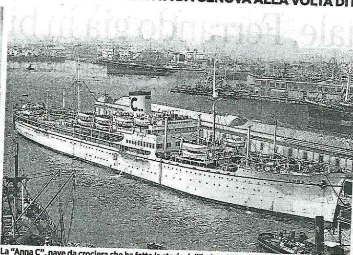
La "Anna C", nave da crociera che ha fatto la storia dell'industria marittima italiana