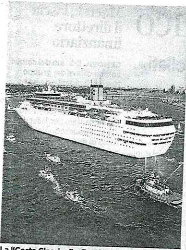
La "Costa Classica" a Fort Lauderdale nel 1991