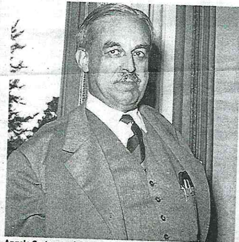
Angelo Costa, uno dei più importanti imprenditori della storia italiana, fu a capo di Confindustria dal 1945 al '55 e dal '66 al '70

GLI ESORDI L'attività della famiglia nasce a metà '800 con il commercio dell'olio