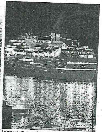
La "Costa Romantica" a Savona nel 2012