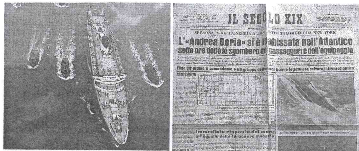
L'Andrea Doria, ammiraglia della flotta italiana. La notizia dell'affondamento del 26 luglio 1956

Ecco, il tributo di Genova alla sua ammiraglia comincia proprio da qui. Dai nomi, in particolare di quei 47 membri d'equipaggio (non facenti parte dello Stato maggiore) che si distinsero, per la commissione, con una condotta lodevole e molto buona durante il naufragio (l'elenco è nel riquadro a fianco). «I loro nomi e le motivazioni dell'inchiesta scorreranno in un video in una sezione della mostra» spiega il direttore