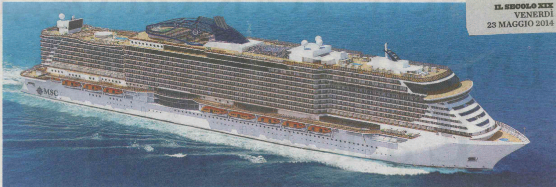
La nuova classe "Seaside" di Msc sarà la nave da crociera più grande mai costruita da Fincantieri